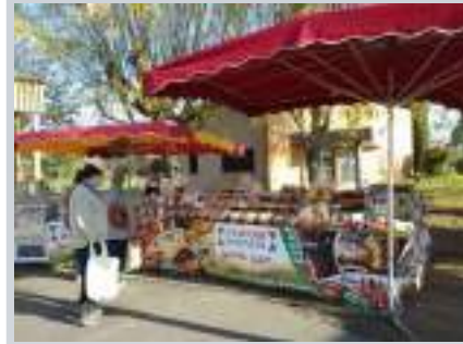
Stand italien d'Alessandro