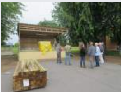
Le kiosque avant... et après sa transformation

Concernant le projet de LGV à l'origine de l'association, il est repoussé à 2037 sans être pour autant totalement abandonné.