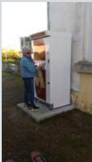
Installée le jeudi 12 novembre 2020 durant l'après-midi... les premiers clients n'ont pas tardé...