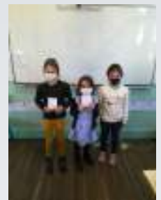
Les trois déléguées de classe.

Pour l'année scolaire 2020-2021, il y a 21 élèves scolarisés à Angeville : 9 élèves de CP, 5 de ce1 et 7 de ce2.