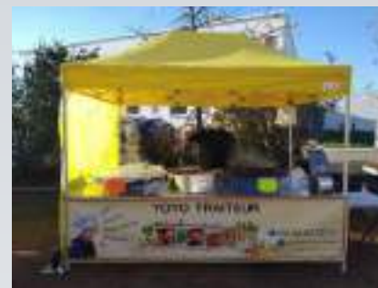
Stand traiteur de Yoyotraiteur