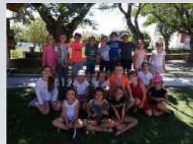
Déconfinement de mai : les élèves de retour.

En mai, dès le déconfinement, les élèves ont rapidement retrouvé les bancs de l'école. D'abord les cp et les ce1, puis les ce2. La vie a repris son cours, et quel plaisir de se retrouver !