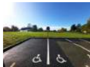
Places pour personnes à mobilité réduite situées devant l'église et le cimetière et sur le parking de la salle des fêtes.