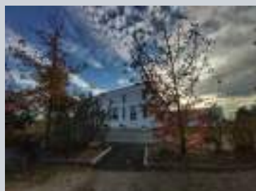
Amenagement d'un passage entre la salle des fêtes et la place centrale du village.