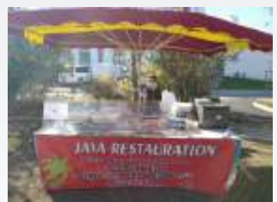
Stand de Java Restauration