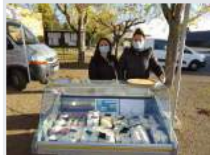
Stand de fromage de la ferme du Peyret