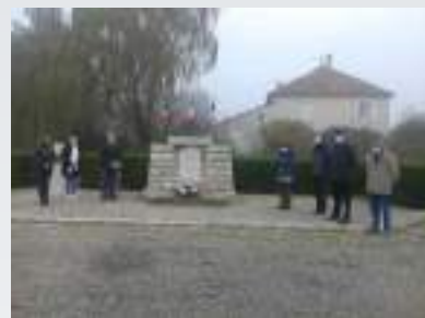
Cérémonie d'hommage à huis clos pour ce 11 novembre 2020 en présence de M. le maire et de quelques élus.